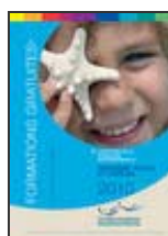
Tourisme social et familial